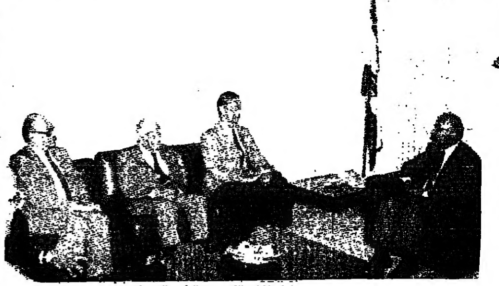
الوفد اللبناني الفرنسي مع الرئيس الحسيني

وحل المجلس النيابي، وبدأ حربه على النواب، وعندما انتخب رئيس للجمهورية رفض تسليم السلطة، واستشهد الرئيس وانتخب رئيس آخر، شامت الظروف ان تسند الي مهامه، مضى في احتفائه بموقع الرئاسة ومكانها، واليوم دعواته الى الانضمام للحل، لان صدر الشرعية يتسع للجميع، ونحن نريد حلا مع عون... لكننا نريد ان لا يستغني نفسه من الحل، كما في المرات السابقة. وخلال اجتماع الوفد بالرئيس عون، شرح للوفد تصوره للوضع، انطلاقا من الطائف وحتى اليوم، وقال انه متفتح على كل حوار، لكنهم يريدون منه الجسم والاذعان لا الحوار المفتوح على حل شامل.